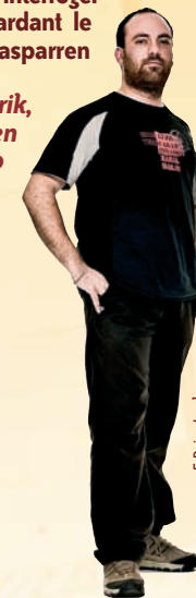
F. Paia - Lanku