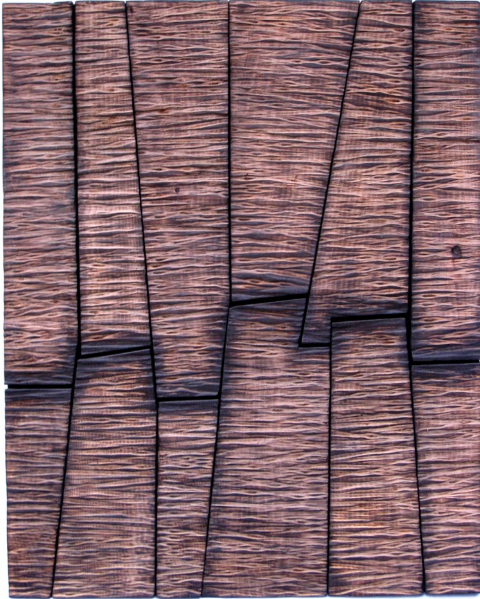
Haustura | 100 x 0.80 m